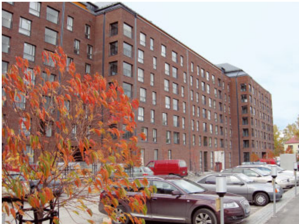
Arto Suikka 8

8 Talon kadunpuoleiset julkisivut ovat kaavoituksen mukaisesti paikalla muurattua punatiiltä. Sisäänkäynnit korostuvat katujulkisivuissa valkobetonisin kehysin.